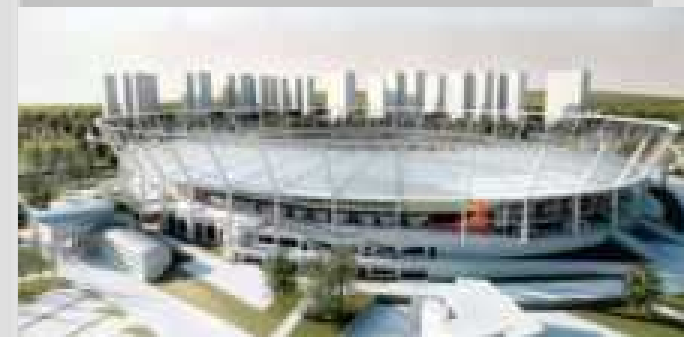
Stadion Narodowy w Chorzowie Huta Pokój S.A. pozyskała do realizacji główną konstrukcję nośną zadaszzenia o łącznej ilości ok.. 7.000 ton konstrukcji stalowej.