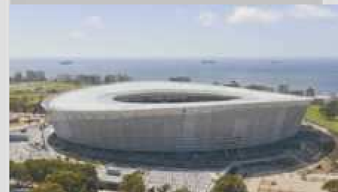
Stadion GreenPoint w Kapsztadzie, RPA Huta Pokój S.A. dostarczyła 1937 elementów (prawie 1.800 ton) konstrukcji stalowej.C