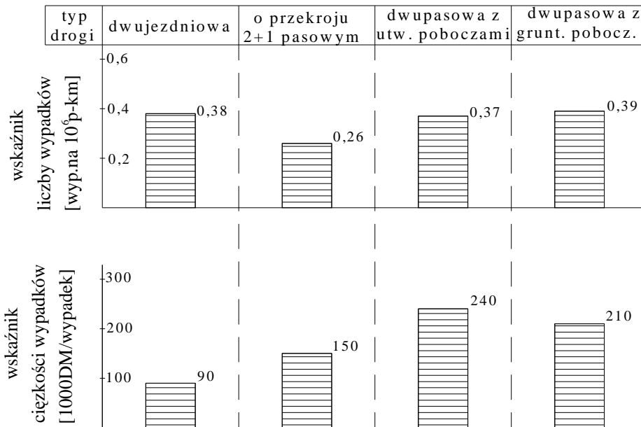
Rys. 1. Wskaźniki wypadkowości na drogach w Niemczech [2]

Takie wyniki uzyskano w Niemczech, gdzie drogi z utwardzonymi poboczami były użytkowane zgodnie z przepisami. Właśnie te, a także inne badania stanowiły wystarczającą podstawę do przekształcenia istniejących w krajach europejskich dróg z szerokimi poboczami na drogi o przekroju 2+1 pasowym lub na drogi o przekroju miejskim, jeżeli wynikało to z zagospodarowania otoczenia drogi. W Polsce statystyki te byłyby bardziej niekorzystne dla przekroju z szerokimi poboczami utwardzonymi, gdyż zachowania uczestników ruchu na naszych drogach są bardziej ryzykowne i często bez poszanowania praw innych uczestników ruchu.