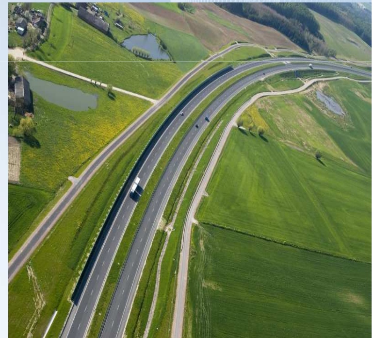
Autostrada A1 Rusocin – Nowe Marzy