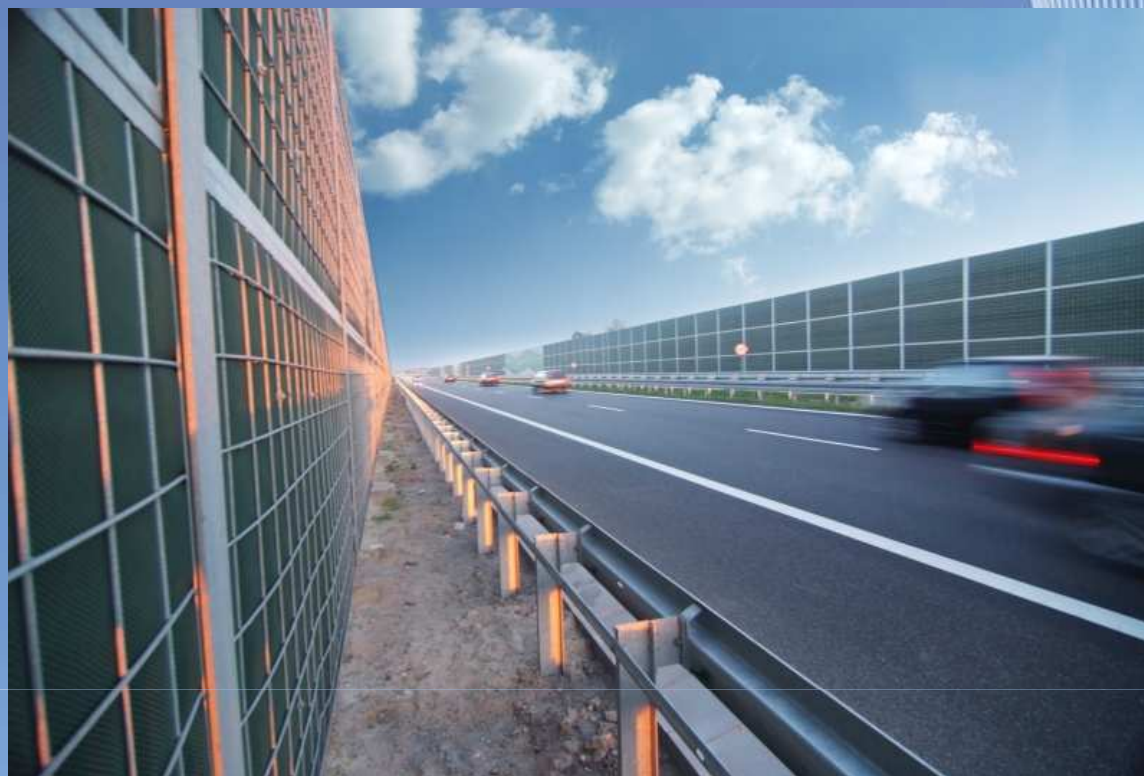
Droga ekspresowa S7 Białobrzegi - Jedlińsk