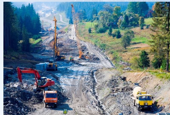
Budowa drogi ekspresowej S69 Szare - Laliki